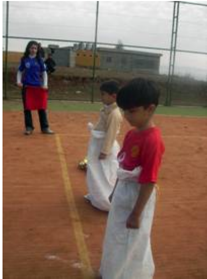
٤- ه‌و‌یشت‌نی قورسای ٢ کیلویی سه‌ره‌تایی. ٥- ه‌و‌یشت‌نی قورسای ٤ کیلویی ناوه‌ندی. شایانی ناماژه‌ پیک‌ر‌ده‌ که ته‌م فستیقاله‌ له‌ ریکه‌وتی ٨٥/١١/١٩ دا کۆتایی به‌ کاره‌کانی خۆی هینا.