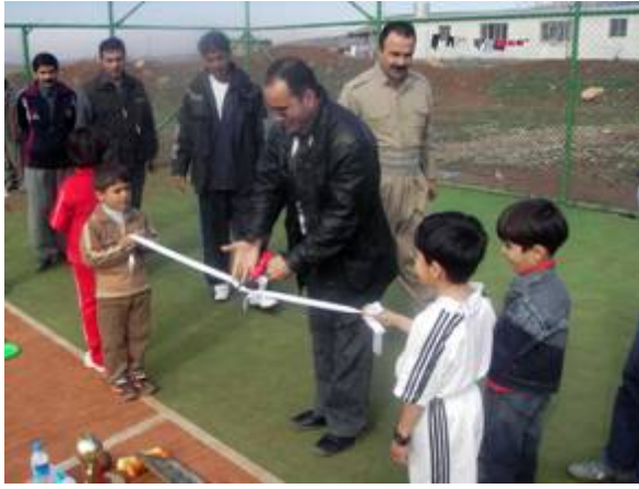
١ی کوردستانیش، کینه‌رکی زانیاری و چ‌ر‌و‌ک و نه‌ق‌اشی به‌رپه‌وه‌ چ‌و. بواره‌ وهرزشییه‌کان له‌م فستیقاله‌دا بریتی بوون له: ١- وهرزشه‌ بچ‌و‌که‌کانی تایبعت له‌ سا‌وایانی روه‌زه‌. ٢- راکردنی خ‌یرایی ٦٠ م‌یتری سه‌ره‌تایی. ٣- ریزگۆلی سه‌ره‌تایی.

له‌ ریکه‌وتی ١٢ی رێبه‌ندان‌ی ١٣٨٥ی هه‌تای، دنیای مندا‌لان و ده‌ک ناوه‌ندی به‌رپه‌وه‌یه‌ری سیپه‌مین فستیقالی وهرزشی - زانیاری مندا‌لانی کوردستانی روژه‌لات، به‌پێی ره‌و‌الی سا‌لانه‌ی خۆی و له‌کاتی پشوری نیوه‌ی سا‌لدا فستیقالی زانیاری و فه‌ره‌ه‌نگ‌ی وهرزشی، به‌ به‌ش‌داری ژماره‌یه‌کی به‌ر‌چاو له‌ مندا‌لانی که‌مه‌یه‌کانی حیزبی دیموکراتی کوردستانی ئێران به‌رپه‌وه‌ چ‌و. ته‌م فستیقاله‌ ٧ روژی خایاند و له‌لایه‌ن به‌رپه‌زان دو‌کت‌ور نا‌وات، دو‌کت‌وری ئورت‌و‌پ‌یدی نه‌خ‌وش‌خانه‌ی نازادی و په‌رو‌یز مه‌راغه‌یی، وهرزشکاری د‌یری‌نی حیزبه‌که‌مان کرایه‌وه‌.