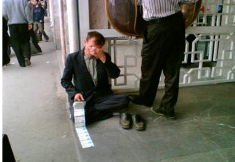
قه‌یرانی کۆمه‌لایه‌تی و ئابووری له‌ ئێرانی ژ‌یر ده‌سه‌لاتی کۆماری ئیسلامیدا!؟