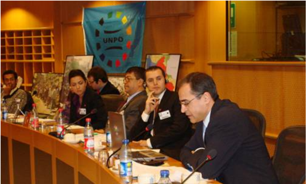
عه بدوئلا حجاب، نوینهری حیزبی دیموکراتی کوردستانی ئێران له UNPO

کوردستانی له گه له. ته وه به مانایه نیه که نه و حیزبه تاقانه حیزبه و حیزبی دیکه له کوردستانی نێراندا وجودیان نیه. به پێچه وان وه، چه ند حیزبی سیاسی دیکه هه هه ن که خا وه نی میژوو و رابردوی تیکۆشانیان هه یه. دیا ره حیزبی واش هه ن