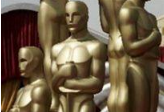
به‌ ب‌لا‌و‌کر‌ده‌وه‌ی فیلمی "روژانی پرش‌کو" که له‌ باره‌ی ته‌م سه‌ربازانه‌ موسلمانه‌ فه‌رانسه‌یی‌یه‌ که له‌ شه‌ری دو‌وه‌می جیهانی به‌ش‌دار بوون و خه‌زه‌ته‌که‌یان له‌ ته‌رت‌ه‌شی فه‌رانسه‌ ب‌ی

پاداش ماوه‌ته‌وه‌. ته‌م فیلمه‌ بوو به‌ هۆی ته‌وه‌ که پاداشی ته‌م سه‌ربازانه‌ له‌لایه‌ن ده‌وله‌ته‌وه‌ ب‌د‌ر‌ی‌ته‌وه‌. روژی ٢٤ی ف‌ی‌و‌ریه‌ فیلمی "دیز ناو کل‌وری" یان روژانی پرش‌کو له‌ ر‌ی‌و‌ه‌می خه‌لاته‌ سینه‌مایی‌یه‌کانی "س‌ی‌ت‌ار" که ها‌وت‌ه‌راز‌ی فه‌رانسه‌یی خه‌لاته‌کانی ئوسکار ده‌ژم‌یر‌د‌ر‌ی، کاندیدای وهر‌گرت‌نی ٩ خه‌لاته‌ له‌ خه‌شته‌ی ج‌زا‌و‌ج‌زی باش‌ترین فیلمه‌کانی سا‌ل‌دا. ته‌م فیلمه‌ که یه‌کێک‌ له‌ ٥ کاندیدای وهر‌گرت‌نی خه‌لاتی ئوسکاری ته‌مه‌ساله‌ له‌ خه‌شته‌ی باش‌ترین فیلمه‌ بیانییه‌کانه‌. فیلمه‌که‌ داستانی سه‌ربازانی موسولمان له‌ کلونیه‌کانی فه‌رانسه‌ له‌ نافریقای با‌کو‌وره‌ که له‌ سه‌رده‌می شه‌ری دو‌وه‌می جیهانی له‌ پ‌ین‌او‌ی نازادی فه‌رانسه‌ خ‌ز‌یان‌یان خه‌سته‌ مه‌تر‌سییه‌وه‌، به‌لام ده‌وله‌تی فه‌رانسه‌ و ده‌